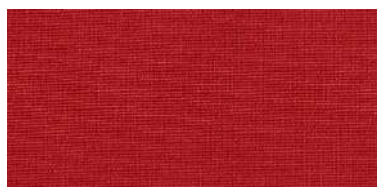
BE-2 | 15