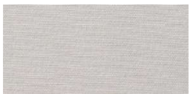
BE-2 | 32