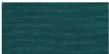
BE-2 | 69