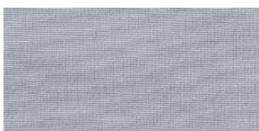
BE-2 | 08