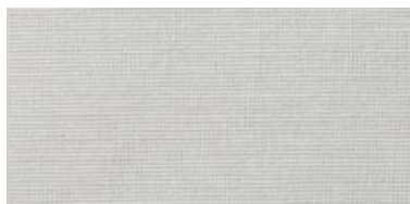
BE-2 | 09