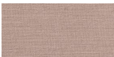
BE-2 | 99