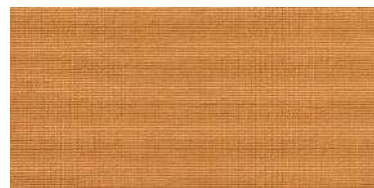
BE-2 | 11