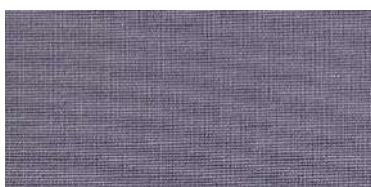
BE-2 | 18