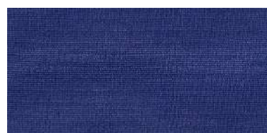
BE-2 | 75