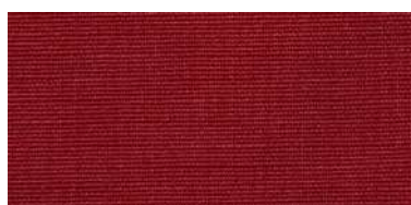
BE-2 | 73