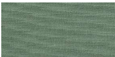
BE-2 | E6