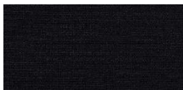
BE-2 | 48