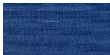
BE-2 | 85