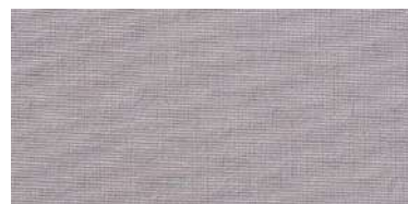
BE-2 | 16