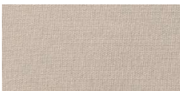
BE-2 | 77