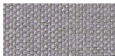
Tapaluz PM | 2021