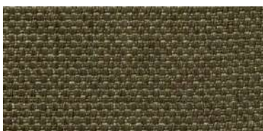
Tapaluz PM | 2115