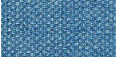
Tapaluz PM | 2055