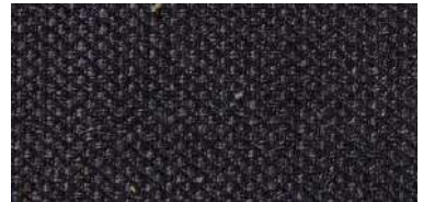
Tapaluz PM | 2012