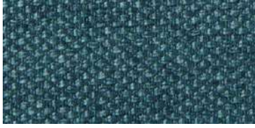
Tapaluz PM | 2056