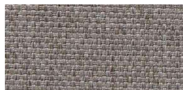
Tapaluz PM | 2004