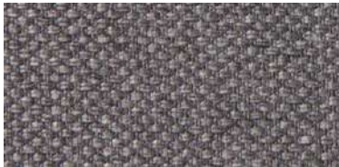
Tapaluz PM | 2020