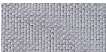
Tapaluz PM | 2001