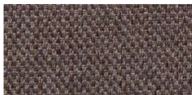
Tapaluz PM | 2022