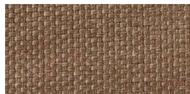
Tapaluz PM | 2117