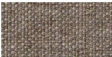
Tapaluz PM | 2003