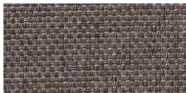
Tapaluz PM | 2008