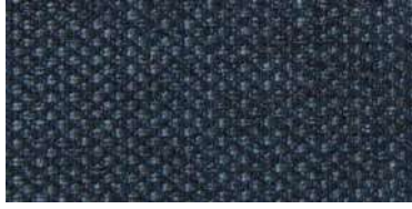
Tapaluz PM | 2078