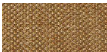
Tapaluz PM | 2011