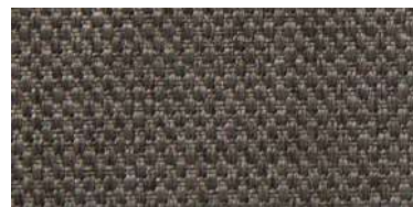
Tapaluz PM | 2108