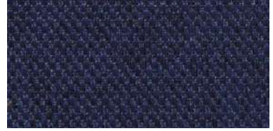
Tapaluz PM | 2084