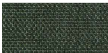
Tapaluz PM | 2121