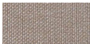
Tapaluz PM | 2002