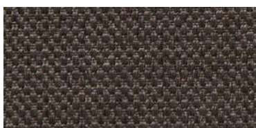
Tapaluz PM | 2126